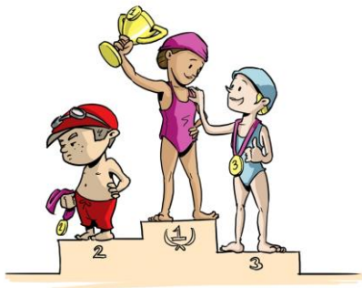
Binky en het podium