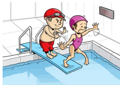
Binkv en zijn teamgenoot

Trainers/coaches en ouders moeten daarom alert zijn op de manier waarop kinderen met elkaar omgaan en duidelijk stelling nemen wanneer bepaalde gedragingen hun norm overschrijden.