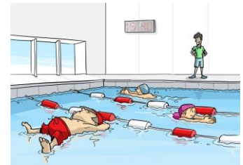
Binky op de training