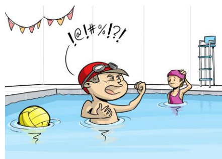
Binky heeft een grote mond